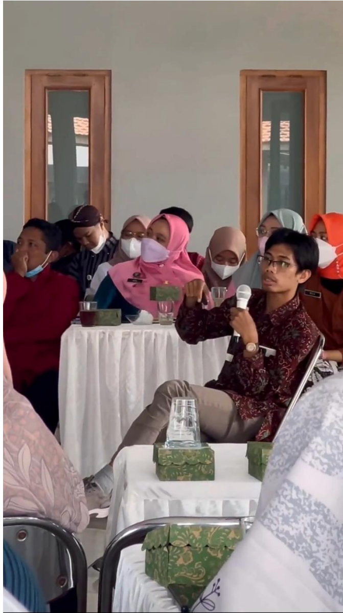
Gambar 3 Mengikuti Sosialisasi Pengelolaan Media Sosial