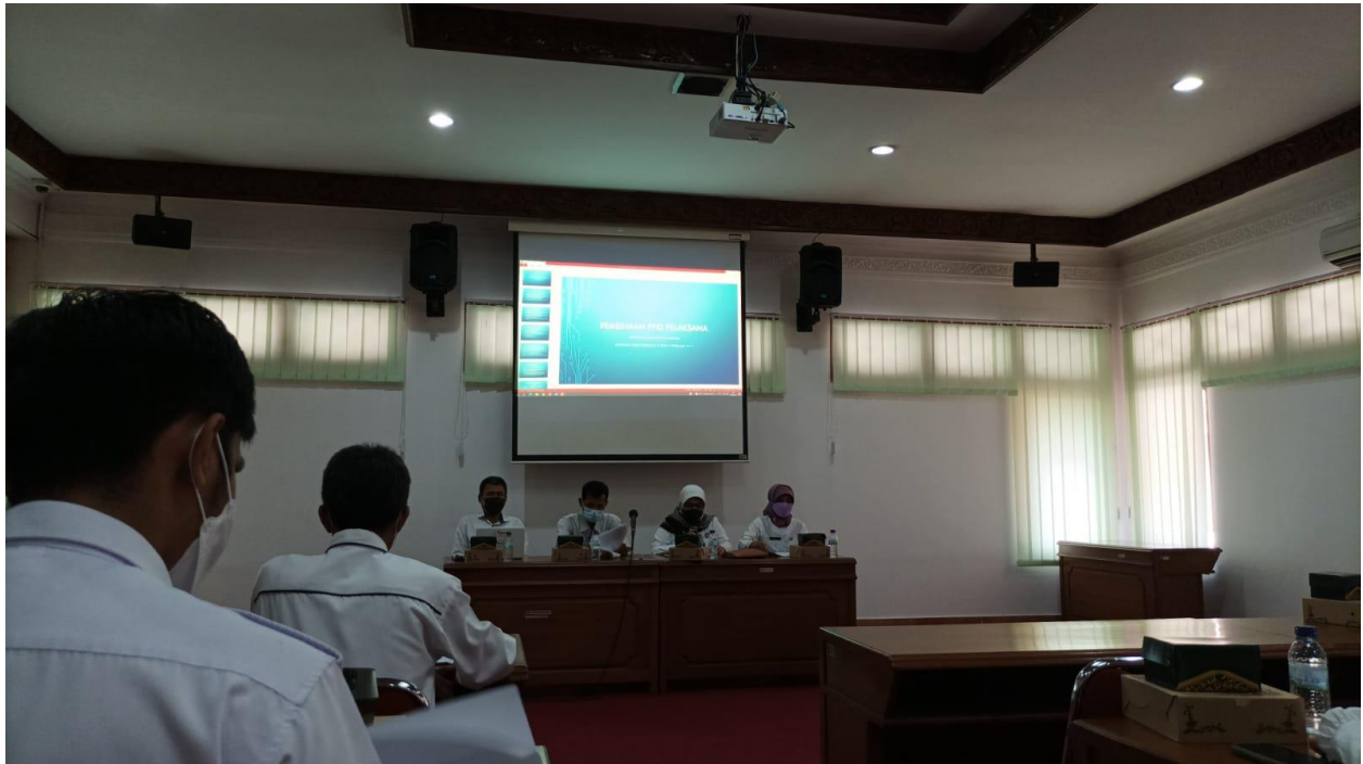
Gambar 1 Rapat Pembinaan PPID Tahun 2022