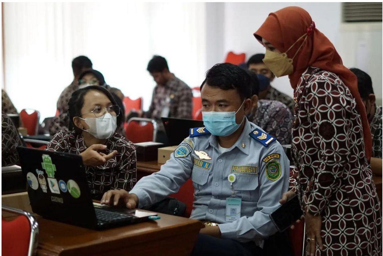
Gambar 2 Mengikuti Pendampingan Pengisian Kuesioner Monev KIP Tahun 2022 melalui Portal E-Monev